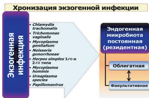
Рис. 3. Взаимодействие экзогенной половой инфекции с эндогенной микробиотой влагалища

В дальнейшем при хронизации экзогенной половой инфекции (примерно через 6 мес после инфицирования независимо от наличия или отсутствия терапии) такие патогены, как Chlamydia trachomatis , Trichomonas vaginalis , Mycoplasma genitalium , Neisseria gonorrhoeae , Herpes simplex 1-го и 2-го типа, Papillomavirus и другие, наряду с Mycoplasma hominis , Ureaplasma species и грибами рода Candida , могут находиться в составе факультативной условно-патогенной микробиоты вагинального биотопа со всеми особенностями их влияния на местный микробиоценоз. При этом чаще всего (даже после адекватного лечения) хламидийная, герпетическая и папилломавирусная инфекции