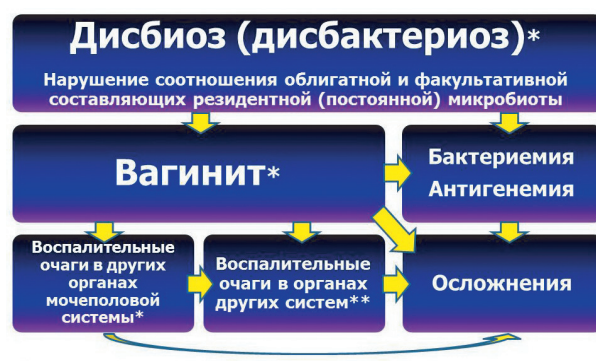
Рис. 2. Этапность формирования эндогенной инфекции (ЭИ) у женщин

Из осложнений в первую очередь обращает на себя внимание нарушение фертильности в виде трубно-перитонеальной, эндокринной и маточной его форм. Трубно-перитонеальное бесплодие формируется за счет органического или функционального нарушения проходимости маточных труб из-за воспалительного процесса; эндокринное бесплодие — за счет овуляторных нарушений и нарушений желтого тела, которые бывают при воспалительном процессе в яичниках; маточное бесплодие — за счет нарушения созревания эндометрия при воспалительном процессе в матке.